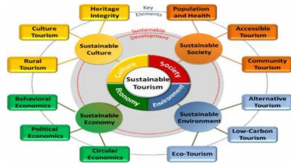
Gambar 2. Four conceptual aspects required for achieving sustainable tourism.

Konsep pengembangan pariwisata berkelanjutan dapat digambarkan sebagai berikut :